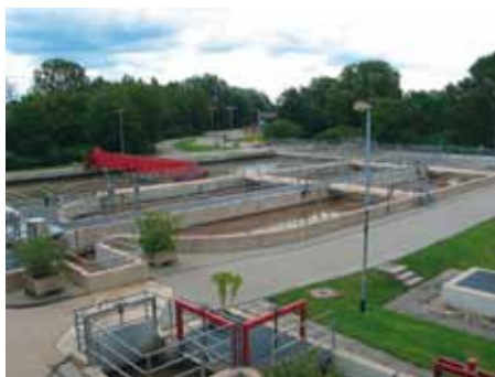
Bild 1: Hochbeanspruchte Stahlbetonbauteile der Kläranlage Bonn-Beuel

Stahlbetonbauteile werden in Abwasseranlagen aufgrund der Zusammensetzung des Abwassers und der biologischen Reinigungsprozesse hoch beansprucht.