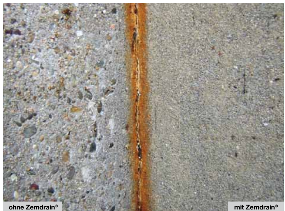
Bild 3: Betonoberflächen der Innenflächen des Klärbeckens, rechts Außenwand mit Zemdrain® hergestellt, links Überlaufwand ohne Zemdrain® hergestellt.

Insgesamt wurden 18 Betonbohrkerne aus dem Nitrifikationsbecken der Kläranlage Offenburg-Griesheim und 14 Betonbohrkerne aus dem Belebungsbecken der Biologie der Kläranlage Bonn-Beuel entnommen und beton-technologisch untersucht.