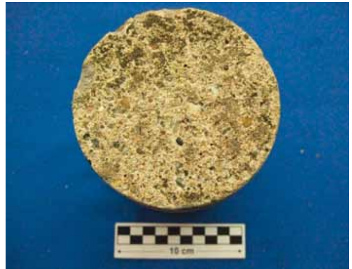
Bild 6: Probe M5, Betonoberfläche vor der Frost-Tau-Wechselprüfung, Herstellung der Betonoberfläche ohne Schalungsbahn

Die Abwitterungsmengen des Betons sowohl oberhalb als auch unterhalb des Wasserspiegels zeigen bei beiden Kläranlagenbauwerken, dass die Abwitterungsmengen bei Anwendung der Schalungsbahn wesentlich reduziert wurden und weit unterhalb des Grenzwertes der ZTV-Ing. liegen.