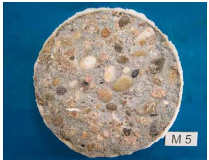
Bild 7: Probe M5, Betonoberfläche nach der Frost-Tau-Wechselprüfung, Herstellung der Betonoberfläche ohne Schalungsbahn