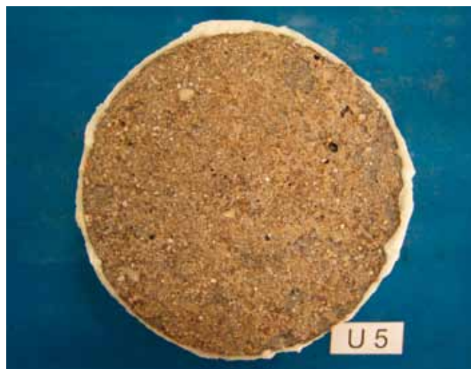
Bild 5: Probe U5, Betonoberfläche nach der Frost-Tau-Wechselbeanspruchung, Herstellung der Betonoberfläche mit der Schalungsbahn